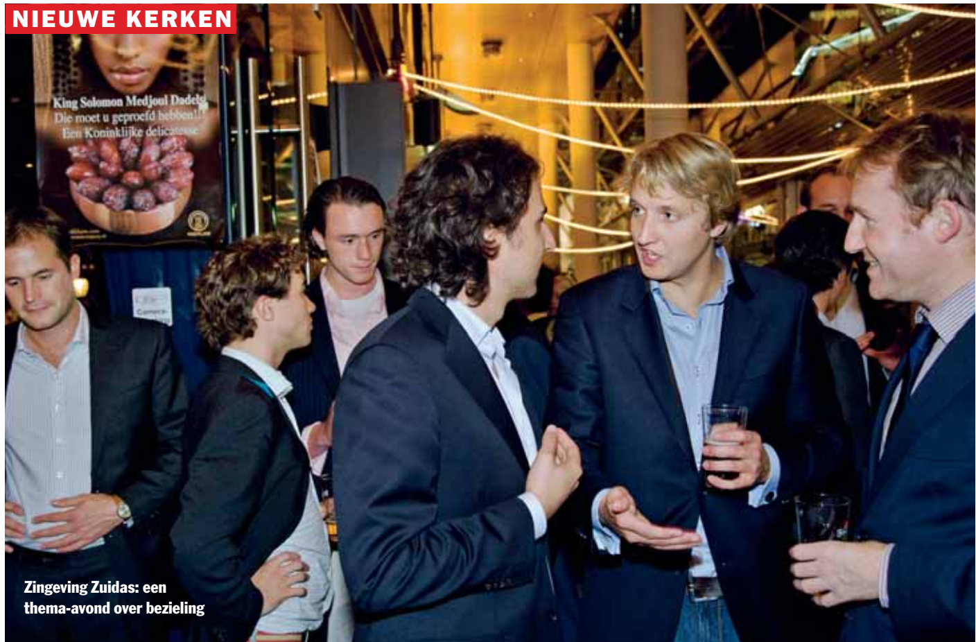
Zingeving Zuidas: een thema-avond over bezieling