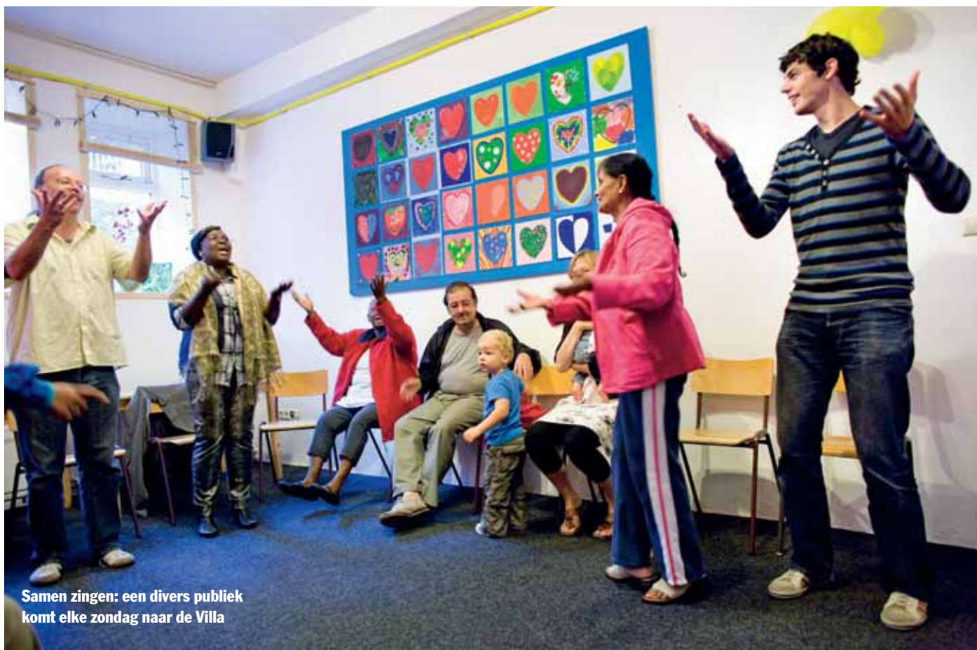
Samen zingen: een divers publiek komt elke zondag naar de Villa