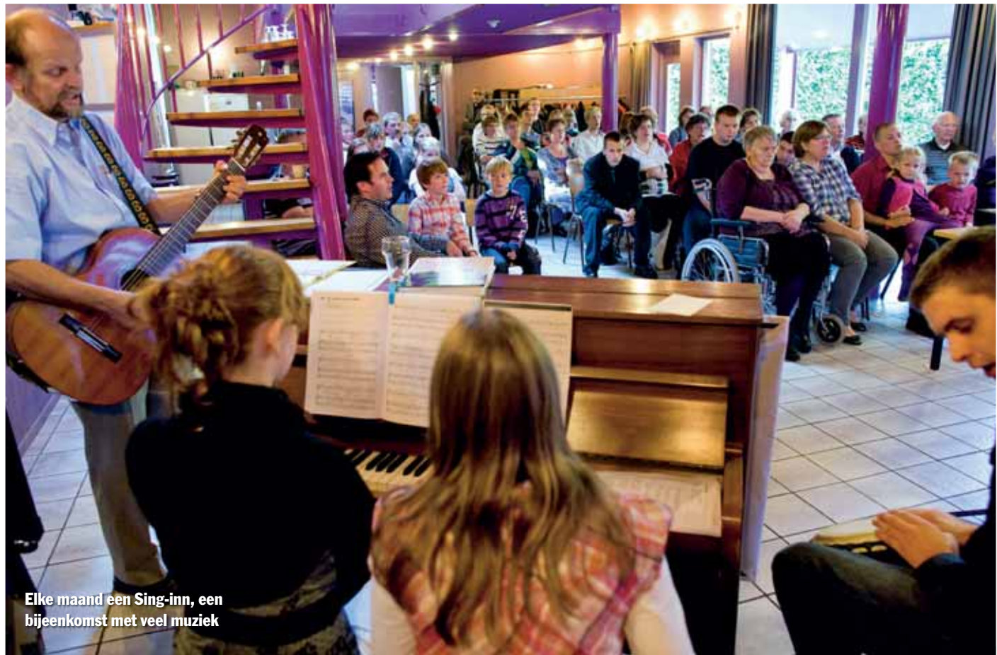
Elke maand een Sing-inn, een bijeenkomst met veel muziek